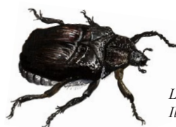
Läderbagge. Illustration: Per Wedholm

Ekåsen ingår i ett av landets finaste drumlinområden. En drumlin är en flackt välvd kulle som formades under istiden. De torra, fasta drumlinkrönen användes tidigt som färdvägar och boplatser. Här finns spår som visar att människor funnits i området sedan yngre stenålder. I reservatets södra del ligger två gravfält, Domarbacken och Vilsta ör, med sammanlagt ca 140 gravar från järnåldern (500 f Kr–1050 e Kr). Strax öster om dessa gravfält finns en fångstgrop där vargar sägs ha fångats förr i tiden. I reservatets nordöstra del finns ytterligare ett gravfält med ca 20 gravar från järnåldern. Norr om detta gravfält finns två hålvägar. En hålväg är en äldre väg som genom lång användning har nötts ner och ser ut som en skålad ränna i marken.