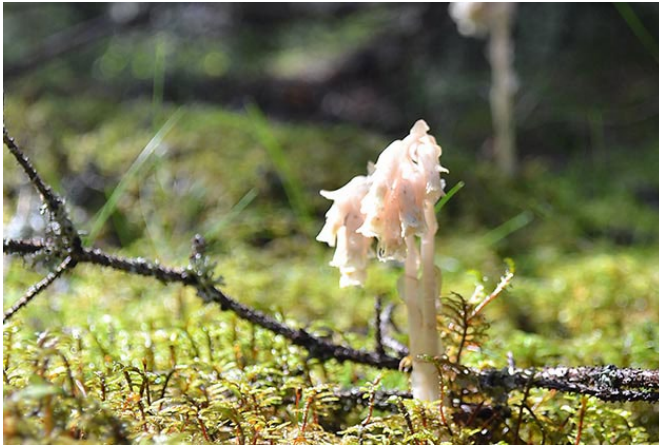
Tallört (t v) och lunglav (t h).

Naturreseptat Norrbyhammar består mestadels av barrblandskog med ett stort inslag av asp. På aspstammarna finns en rik flora av mossor, lavar och svampar.