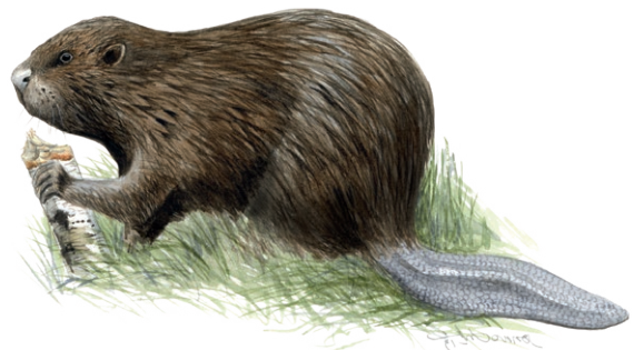
Bäver. Illustration: Jonas Lundin

I Skedviån finns en livskraftig bäverstam. Utefter åstranden har bävrarna fällt en hel del aspar, men också grävt ett vidlyftigt system av gångar i området. Har du tur kan du även få se utter vid ån. Skedviåns stränder nyttjades i gamla tider som ängsmark, översvämningar gödslade stränderna som gav ett rikt hö. I skogen fick djuren förr gå fritt och beta. Idag är det främst vildsvin som bökar runt här i skogen.