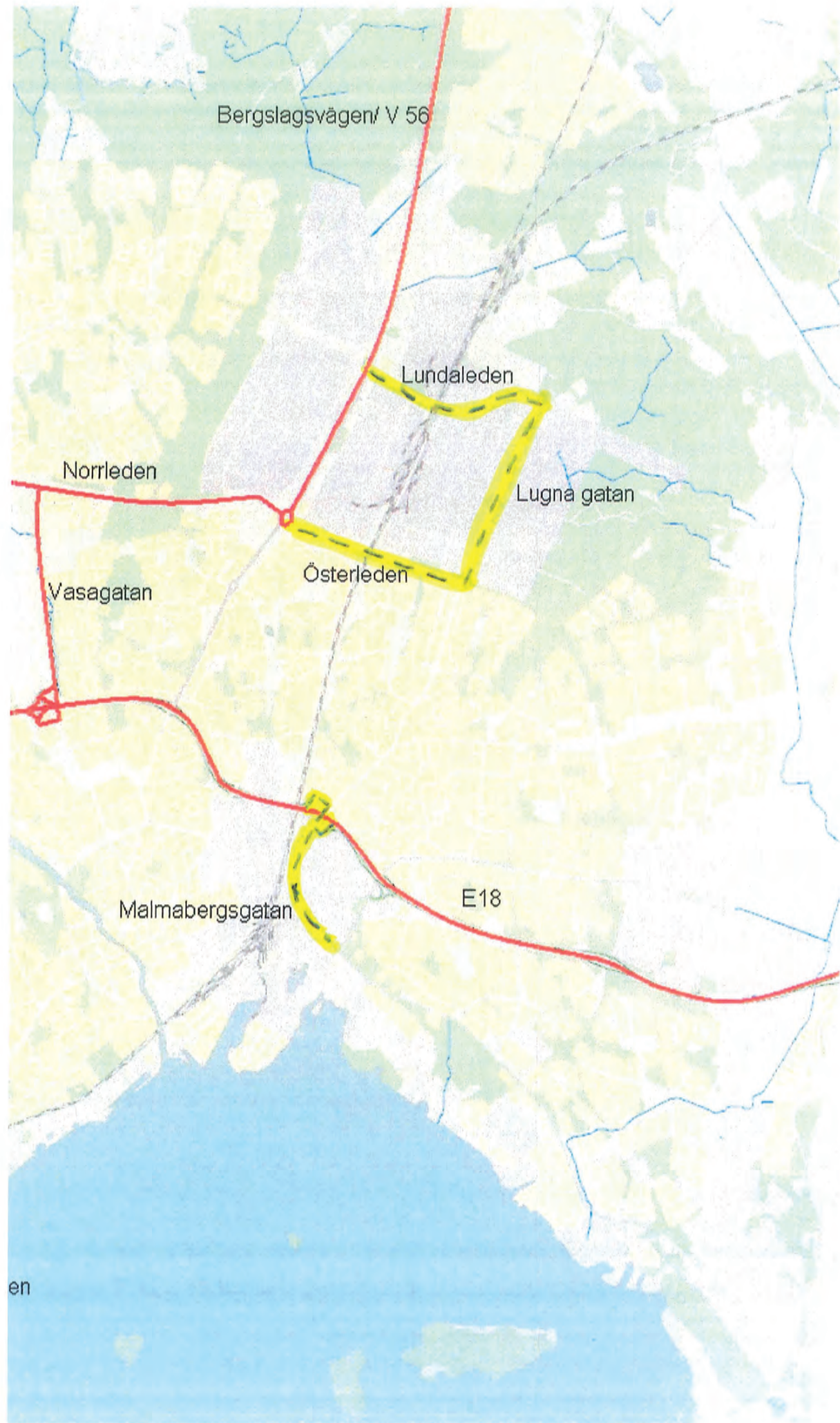
Bilaga A. Karta över upplåttna vägar för farligt gods inom Västerås kommun