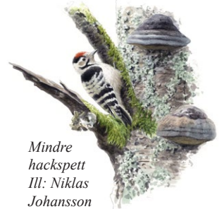
Mindre hackspett Ill: Niklas Johansson