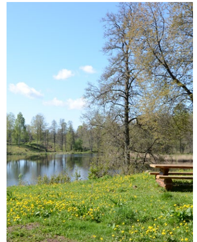
Backsippa till vänster, en av områdets dödisgröpar i mitten samt utsikt över sjön Trehörningen till höger.

I Snavlunda och Tjälvesta skyddas ett kulturlandskap med anor från järnåldern. Här kan du ströva genom böljande ängar och grönskande lövlundar. De välbesökta naturreservaten ligger sida vid sida strax norr om Askersund.