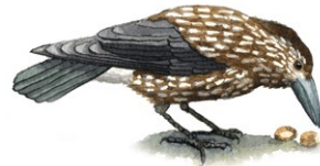
Nötkräka