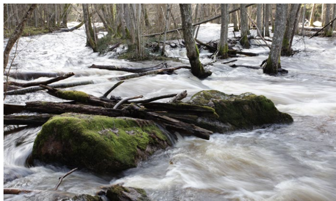
Järleåns vattenmassor på väg mot Väringen och så småningom Östersjön.

I den fuktiga och skuggiga miljön kring ån frodas såväl lövträd som många mossor och lavar. Klosterlav är vanlig på många av de äldre ädellövträden. I reservatet finns även flera sällsynta arter som fjällav och trubbfjädermossa. Gott om död lövved lockar förutom svampar, lavar och mossor även olika insekter. Vilka i sin tur gör den döda veden till ett eftertraktat skafferi för många fåglar, som exempelvis mindre hackspett.