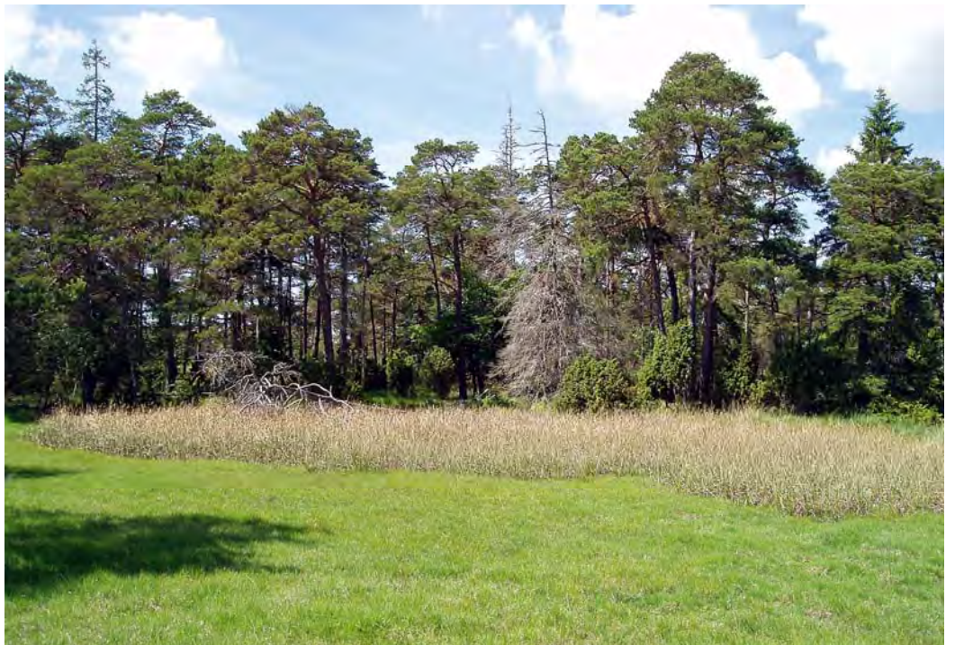
Kalkfuktäng omgiven av barrskog i den sydligaste delen av reservatet.