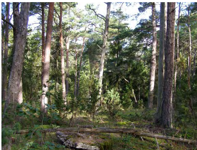
OVAN & NEDAN: Kalkbarrskog i den norra delen av området.

I nordväst, i sluttningen ned mot Hideviken, utgörs skogen av ett olikåldrigt och luckigt barrblandbestånd (kalkbarrskog) med senvuxna, delvis undertryckta träd i svag sluttning på kalkrik mark. Naturvärdena är främst knutna till de senvuxna träden, inslag av döda träd och lågor samt till den kalkrika marken med förekomst av många sällsynta marksvampar.