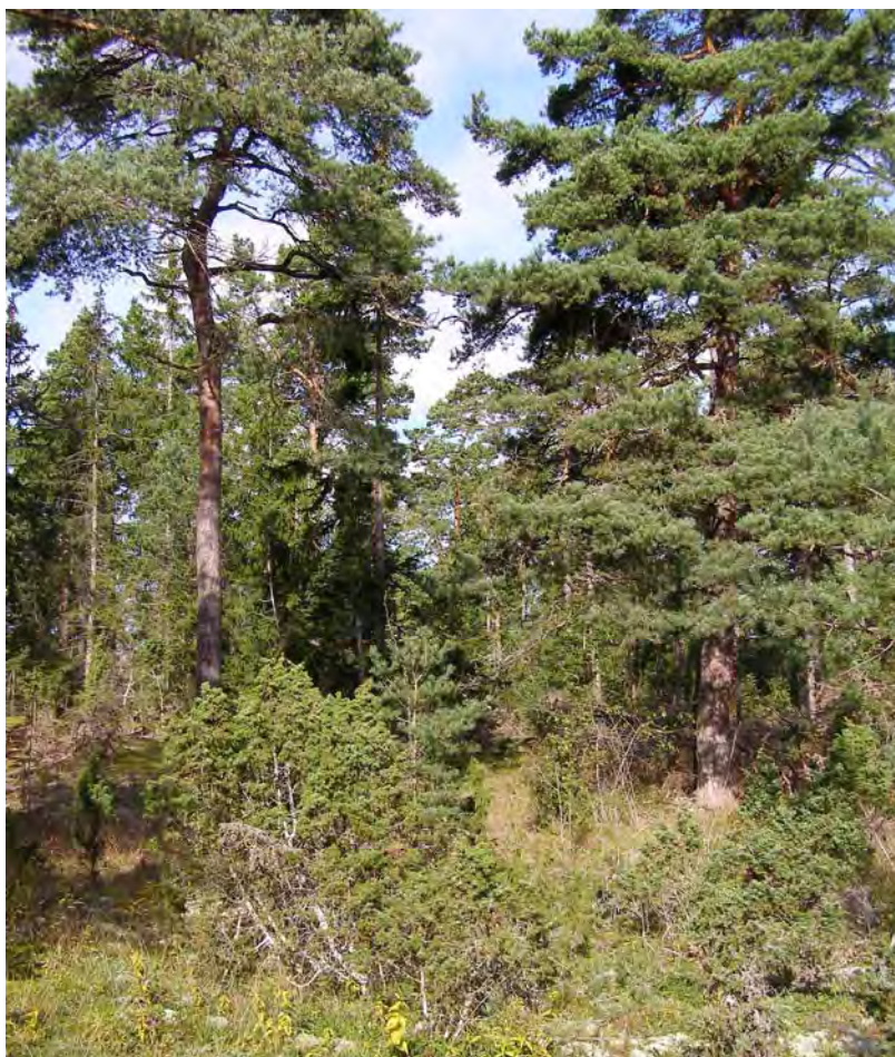
Ovan: Kalkbarrskog i den södra delen av området.

En särskild marksvampinventering utfördes hösten 1996, och i området har påträffats bl.a. ett mycket stort antal rödlistade svamparter: gropbucklig taggsvamp, lilaköttig taggsvamp, vit taggsvamp, slät taggsvamp, brantaggsvamp, odörspindling, svartgrön spindling, duvspindling, violettrandad spindling, granrotspindling, pluggtrattskevling, lammticka, mjölmusseron och svartfjällig musseron.