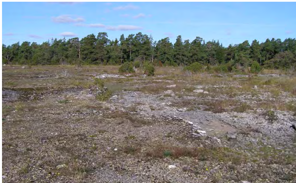
Ovan & nedan: Hällmarker i den mellersta delen av reservatet.