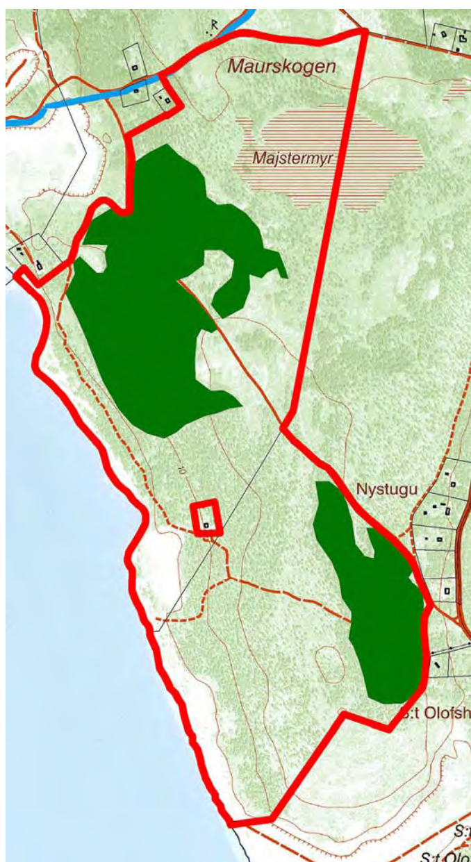
Gröna områden = skogliga nyckelbiotoper

Det aktuella skogsområdet utgörs huvudsakligen av talldominerad barrskog med en medelbonitet på ca 2,2 m 3 sk/ha och år. Av den totala arealen produktiv skog (61 ha) är närmare 40 % (24,7 ha) klassad som skoglig nyckelbiotop (se kartan nedan), men även övriga delar av skogen har mycket högt värde från naturvårdssynpunkt.