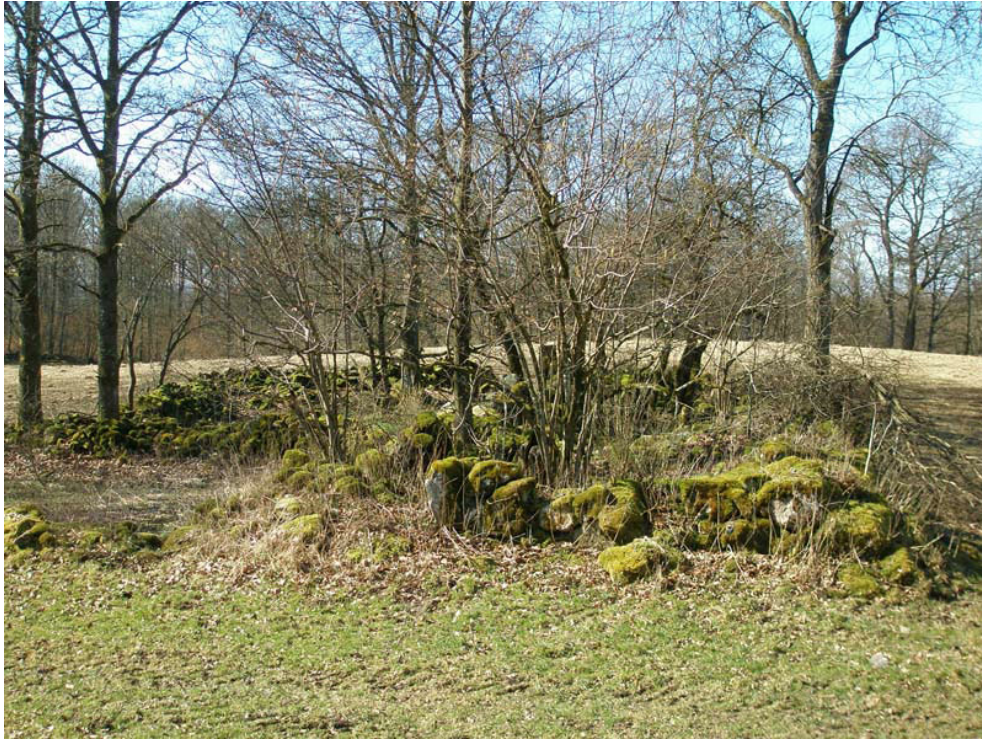
Figur II.6. Räcker det med en kartering av synliga lämningar (RAÄ Norra Rörum 215)?

Ibland har förvisso lägenhetsbebyggelsen varit avhängig blott en mindre täppa. På senare år har trädgårdsarkeologin ryckt fram med resultat från såväl landsbygd som städer, med dateringar upp i tidigmodern tid (Andréasson m.fl. 2014). Vid torpen kan på ett övergripande plan frågan om närvaro/avsaknad av trädgårdar, parker och alléer diskuteras (Lind m.fl. 2000). Under åren 2004–2006 genomfördes ett forskningsprojekt, Det biologiska kulturarvet, som ägnades åt inventering och dokumentation av kulturväxter kring övergivna torp. Detta ledde i sin tur till utvecklingen av en metod att inventera torp och torparens växter, jämte en kursinstruktion under det poetiska namnet ”Syrener i ruiner” (Sköld & Svensson 2009). Inventering av växter är en etablerad metod i anslutning till lägenhetsbebyggelser, som emellertid inte ännu fått större genomslag i arkeologiska sammanhang, utan främst bedrivits inom skogsvård och hembygdsforskning. Skogsstyrelsen i Västmanland har exempelvis konstaterat att ”de nya kunskaperna har höjt bevarandevärdet för de studerade torplämningarna... Dessutom har de samlade kunskaperna betytt mycket för förståelsen av de enskilda platserna”