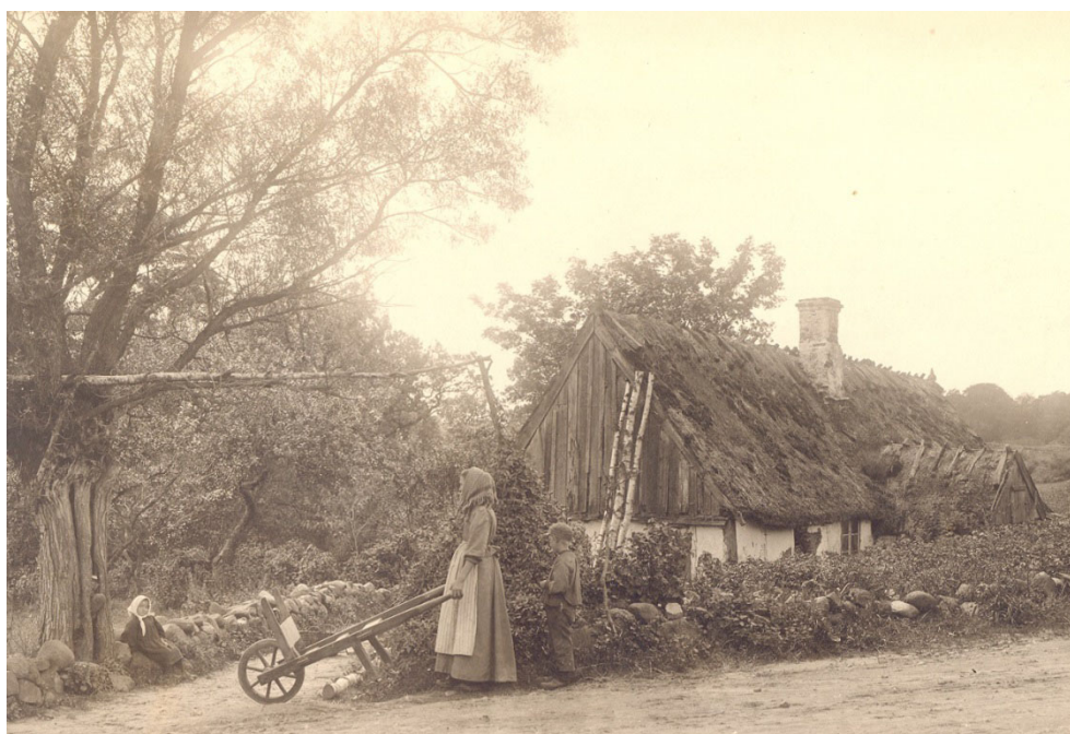
Figur II.7. Någon slags trädgård eller täppa anas kring stugan. stugan låg i Andrarum (cirka 1902).

I andra sammanhang har ovan nämnda inventeringar av kvarvarande kulturväxter varit i fokus (Andersson, Sköld & Åman 2007, Sköld & Svensson 2009). De verkar sällan ha implementerats vid exploateringsarkeologiska situationer, utan hänger mer samman med inventeringar av torp i stort. Utgångspunkten har inte varit frågeställningar, utan mer en målsättning att levandegöra kulturhistoria samt knyta an och bidra till Jordbruksverkets program för odlad mångfald (POM). Förutom att genomsöka skriftliga källor efter uppgifter, inhämta muntliga uppgifter från dagens lokalbefolkning samt på plats systematiskt kartera och bestämma växter (och verkligen pricka in dem i relation till lägenhetsbebyggelsen i fråga), har man gärna inkluderat analyser av äldre foton (figur 18). Växtinventering bör vara en möjlighet även i uppdragsarkeologiska sammanhang, för att fånga upp en så bred bild av vegetations- och odlingshistoria som möjligt. I växtinventeringarna uppdagas dessutom gärna den odling som kanske skett mer till exempelvis behag och nöje, läkekonst och magi.