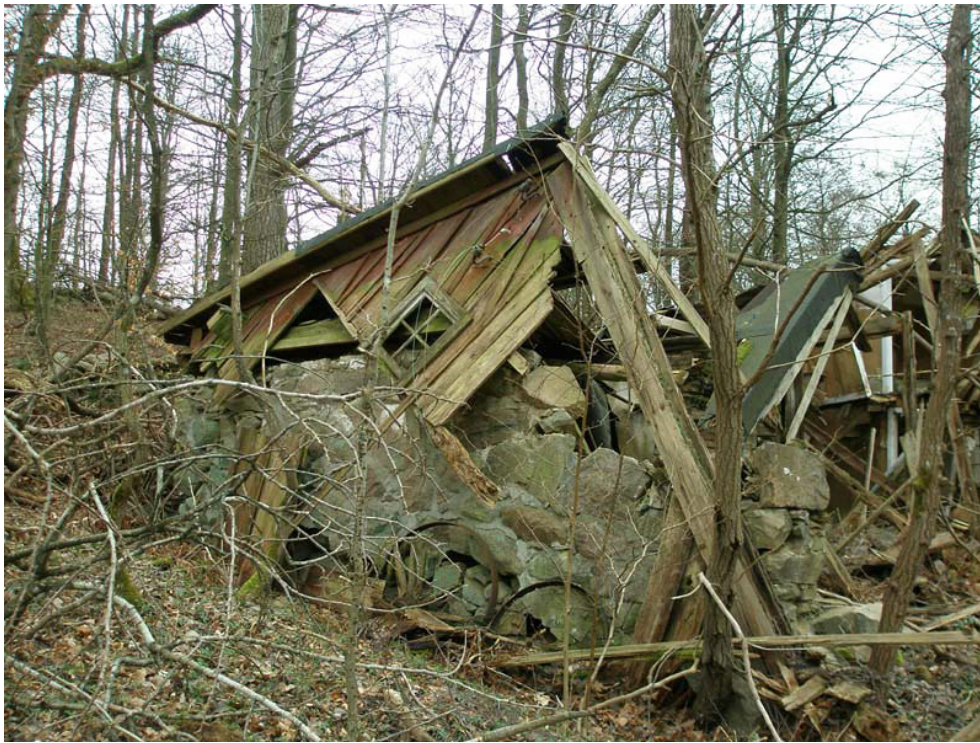
Figur II.5. Bevarandegrad, kunskapsläge, upplevelsevärde... hur ska man resonera när det ibland inte finns några synbara spår alls efter en lägenhetsbebyggelse eller när det som här, RAÄ Norra Rörum 205, finns väldigt mycket kvar?

Kanske kan arkeologins oförmåga att ta sig an fattigdomsaspekter kopplas till de bedömningskriterier som format och fyllt fornminnesregistret, numera FMIS. Bedömningskriterierna för registrering av fornlämning har varit snåriga med många faktorer som skulle viktas mot varandra. Att värdera bevarandegrad mot kunskapsläge, mot upplevelsevärde samt mängden kompletterande källor har som regel utfallit till den historiska arkeologins nackdel (Anglert & Knarrström 2006:55 ff, Blomqvist 2007:52 ff, figur 16). De fattigas föremål, bebyggelse och miljöer kan nog uppfattas som mindre akademiskt aktningsvärt, arkeologiskt givande och spännande. Det kan vara svårt att hävda undersökningar och åtgärder kring en plats som å ena sidan kanske uppvisar fullt synbara strukturer, å andra sidan kan misstänkas innehålla ganska fjuttiga fyndmaterial. Till detta kan man anföra att det man ser sällan är allt som finns, att man inte ska förbise frågan om tidsdjup samt att det just är det kanske fjuttiga fyndmaterialet som är platsens egenart, den kontext som Länsstyrelsen ska tillmäta värde och arkeologen efterforska.