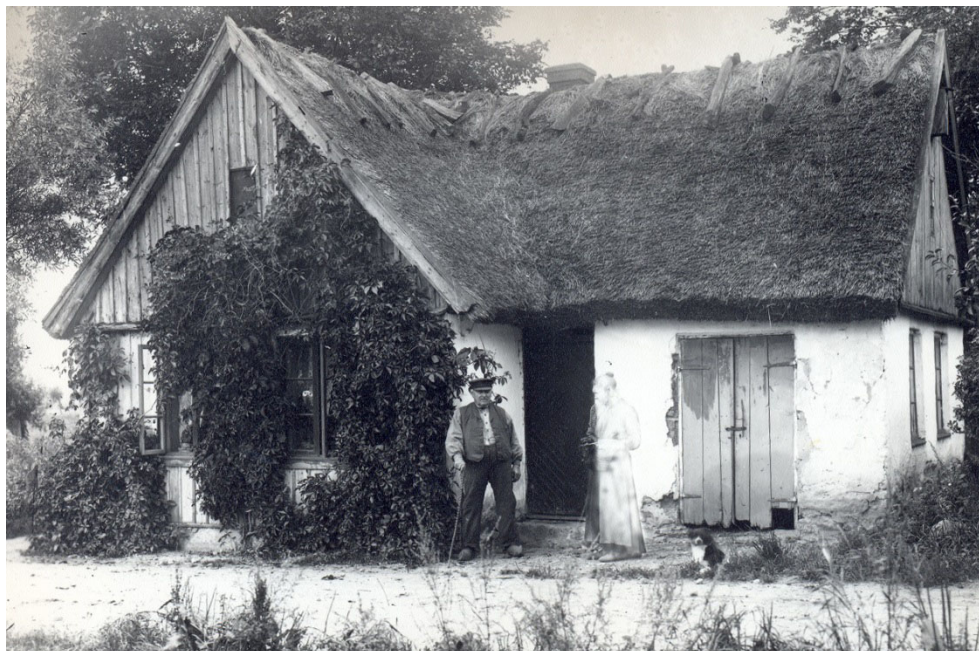
Figur II.2. Alfred B Nilssons fotograferade en stuga i Andrarum, cirka 1902. Ur fornminnesföreningens fotoarkiv på Österlens museum.

13). Samtidigt står det klart att om undersökningar av lägenhetsbebyggelser ska göra intryck på historievetenskaperna i det stora hela samt skrivningen av såväl små som stora historier, krävs perspektiv och frågeställningar som kan vävas in i också andra perioder, sociala miljöer och landskap. Länsstyrelsen i Skåne har konstaterat att nyckelordet ska, som alltid, vara kunskapsuppbyggnad med relevans utanför den partikulära ramen.