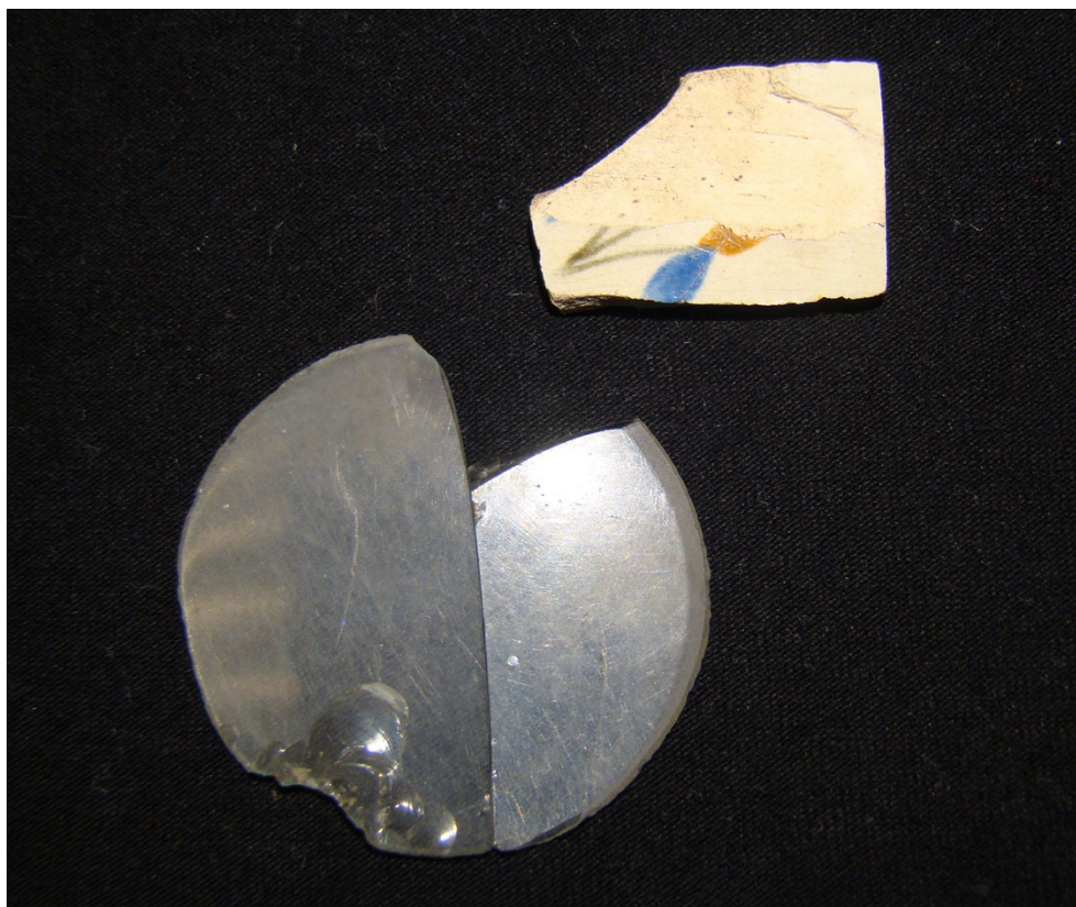
Figur II.3. Någon som bodde på torpet Rosts täppa skaffade sig finporslin och glasögon. Fynd från undersökningarna av ett torp i norra Skåne.

Flera av ovan nämnda modernitetsaspekter berörs. Torparlivet och backstugusittandet betingades som regel av uppmätt tid, i form av till exempel kontrakt och dagsverken. Torparnas personliga kvaliteter hamnar mer i fokus, än när sambandet med en bygd baseras på nedärvd, besutten status – en form av individualisering. I samhället underordnade grupper kan skapa egna kulturer och traditioner, som motstånd eller markering mot de etablerade. Utsattheten har kunnat vara geografiskt understruken, med lägenhetsbebyggelsernas placering på avstånd från byn och gårdsbebyggelserna, långt ut i markerna eller i kanten av byn (Svensson 2005, Rosén 2007a). Lägenhetsbebyggelsernas mer öppna disposition vittnar också om en större utsatthet, men omvänt kanske även större öppenhet (Rosén 2004).