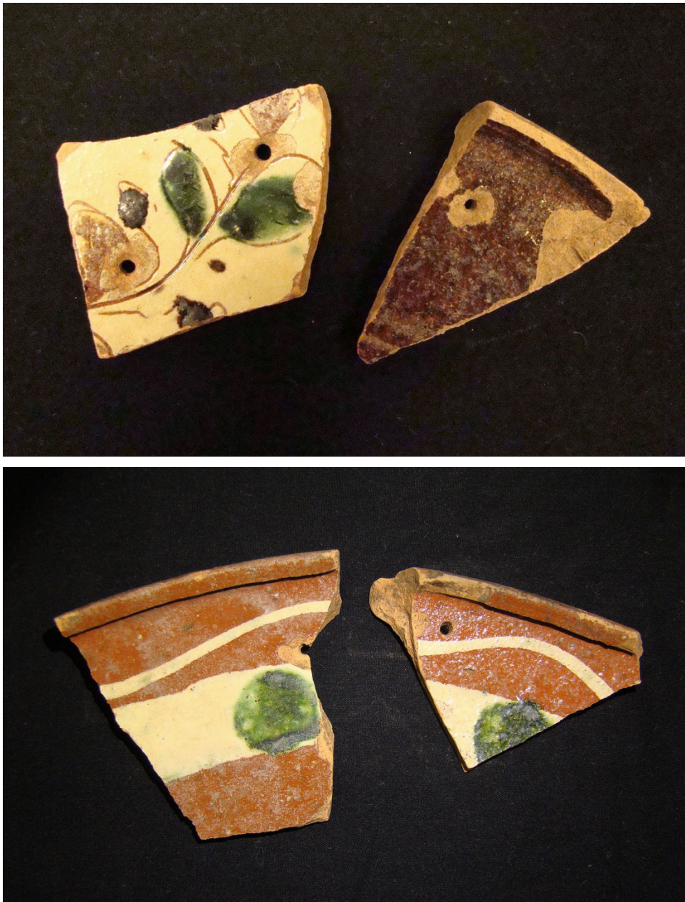
Figur II.4. På torpet Rosts täppa ansågs det mödan värt att lappa ihop keramikkrärl genom att "sy" ihop dem. I fyndmaterialet fanns flera fragment med hål.

Den historiska arkeologin, främst den eftermedeltida och i största utsträckning utanför Västeuropa, har i större utsträckning laborerat med fattigdom som begrepp och analytisk storhet. I Västeuropa har man oftare studerat urbana miljöer, än rurala (jfr Symonds 2011:563 ff, Lihammer 2011:39 ff). Försök att identifiera fattigdomsmarkörer, exempelvis genom att via föremålsfynd studera slitage, synliga reparationer och återbruk, har gjorts (Przybyłok 2013, figur 15a och b). Perspektivet har emellertid så sent som 2011 betecknats som outforskat (Orser 2011). Fler bevarade skriftliga källor ger möjligheter att utöver relativ fattigdom även diskutera absolut fattigdom, men det kräver ingående bearbetning och analys av exempelvis bouppteckningar, liksom insyn i vad som var tidens syn på fattigdom.