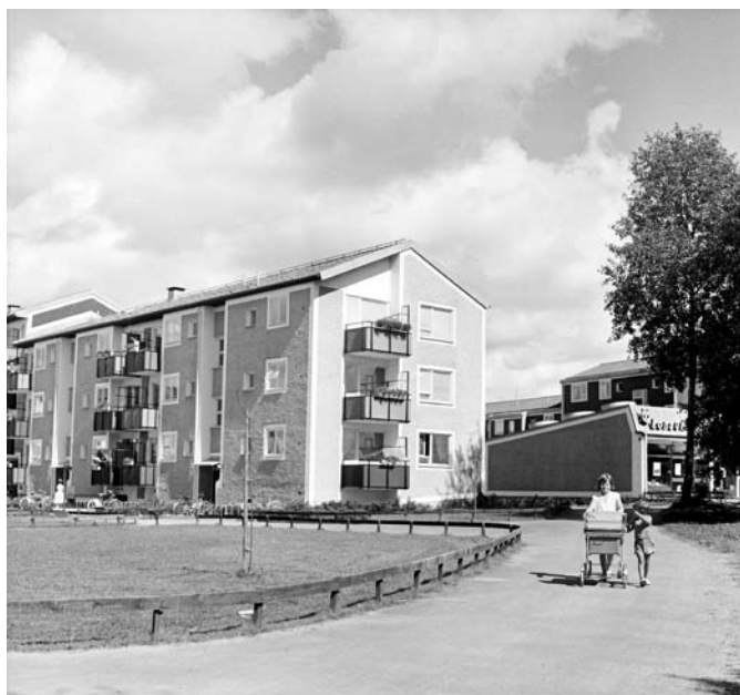
Bostadsområde i Baronbackarna, 1960-tal.