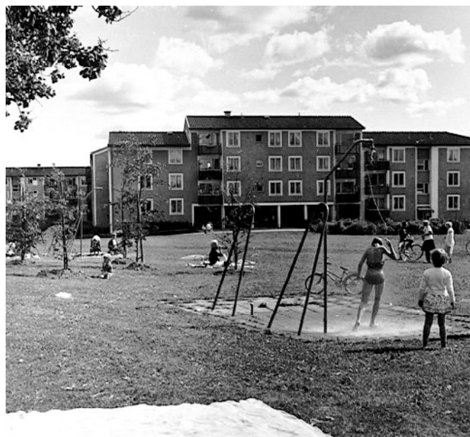
Den gemensamma parken i Baronbackarna, 1960-tal.