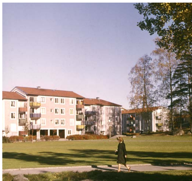
Bostadsområde i Baronbackarna, 1960-tal.