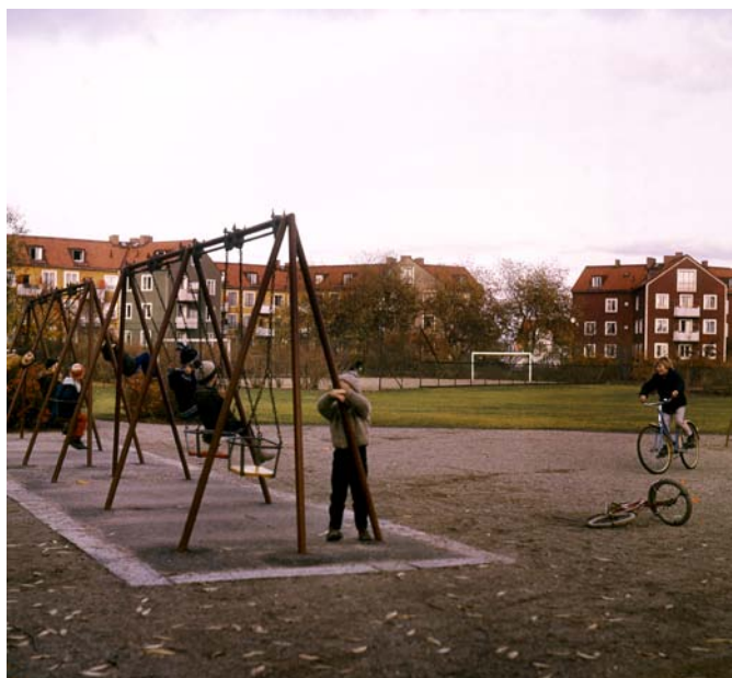
Lekplats i Rosta, 1960-tal.