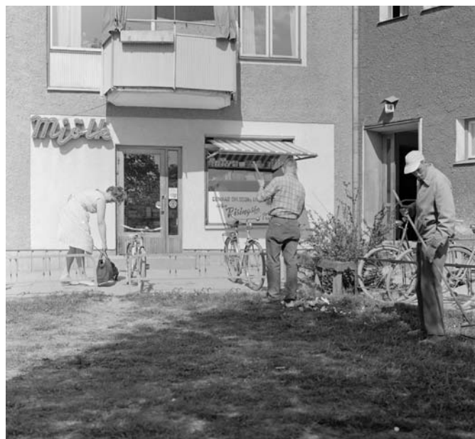
Mjölkkaffär i Rosta, 1960-tal.