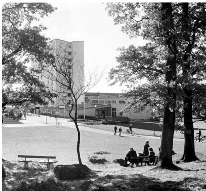
Bostadsområde i Baronbackarna, 1960-tal.