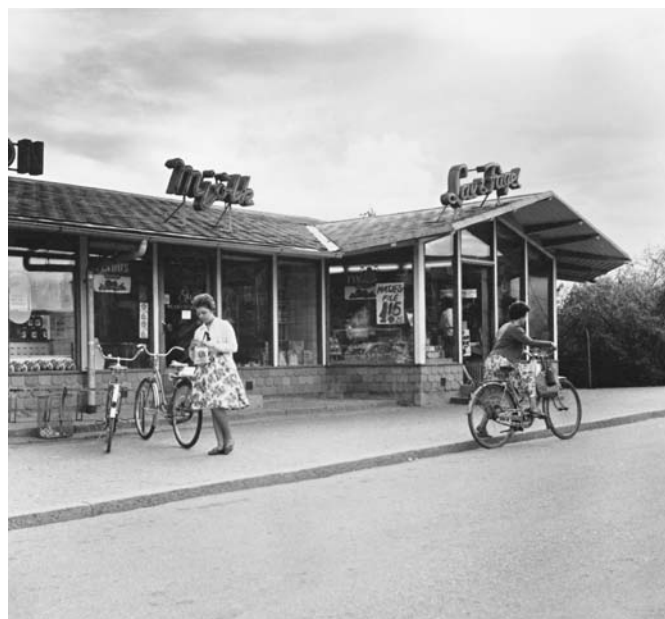
Rosta centrum, 1960-tal.