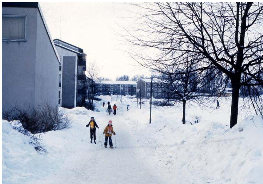
Barn åker skidor i Baronbackarna, 1970-tal.

Mammans arbete i hemmet skulle underlättas och arkitekterna strävade efter att göra lägenheterna så praktiska som möjligt. Förutom att mammorna skulle kunna ha uppsikt över barnen vid lekplatsen via balkongen och köksfönstret fick köket också fönster in till badrummet så att barnen kunde bada