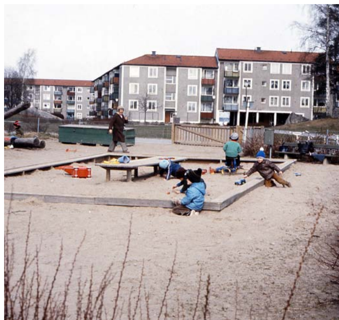
Lekpark i Baronbackarna, 1970-tal.