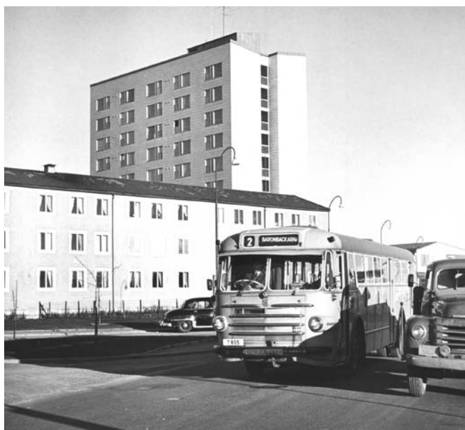
Buss i Baronbackarna, 1960-tal.