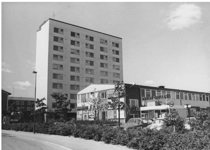
Höghuset i Baronbackarnas centrum, 1960-tal.