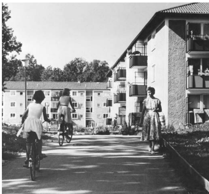
Bostadsområde i Baronbackarna, 1960-tal.