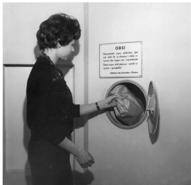
Kvinna vid sopnedkast, Rosta, 1950-tal