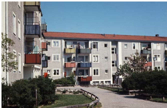
Bostadsområde i Baronbackarna, 1970-tal.