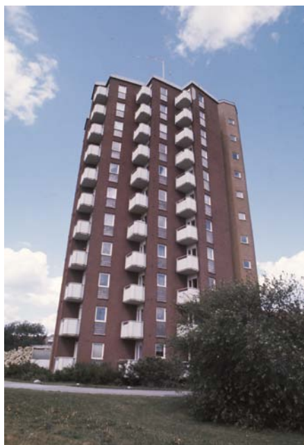
Höghuset i Rosta centrum, 1970-tal.