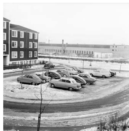
Bilparkering, Baronbackarna, 1960-tal.