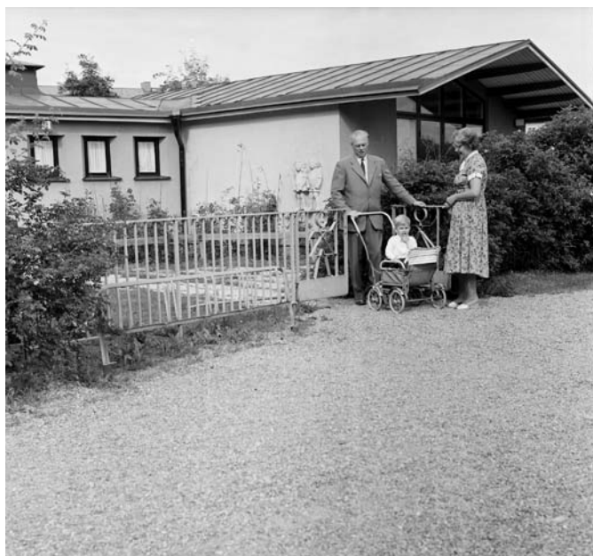
Daghem i Rosta, 1960-tal.