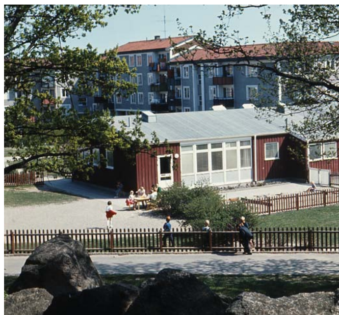
Daghem i Baronbackarna, 1970-tal.