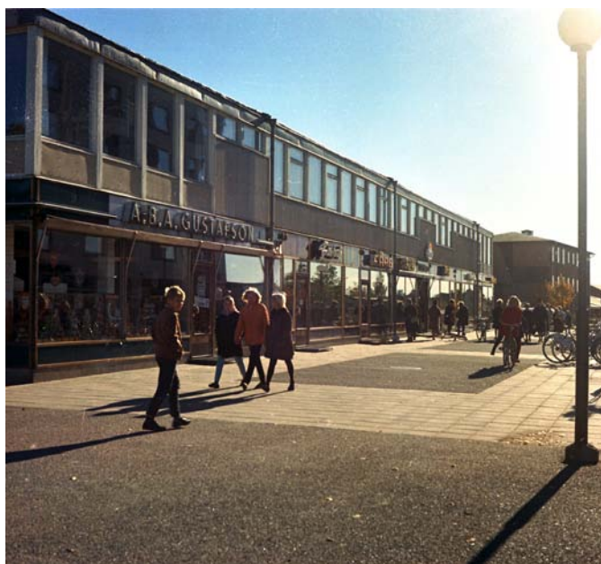
Baronbackarnas centrum, 1960-tal.