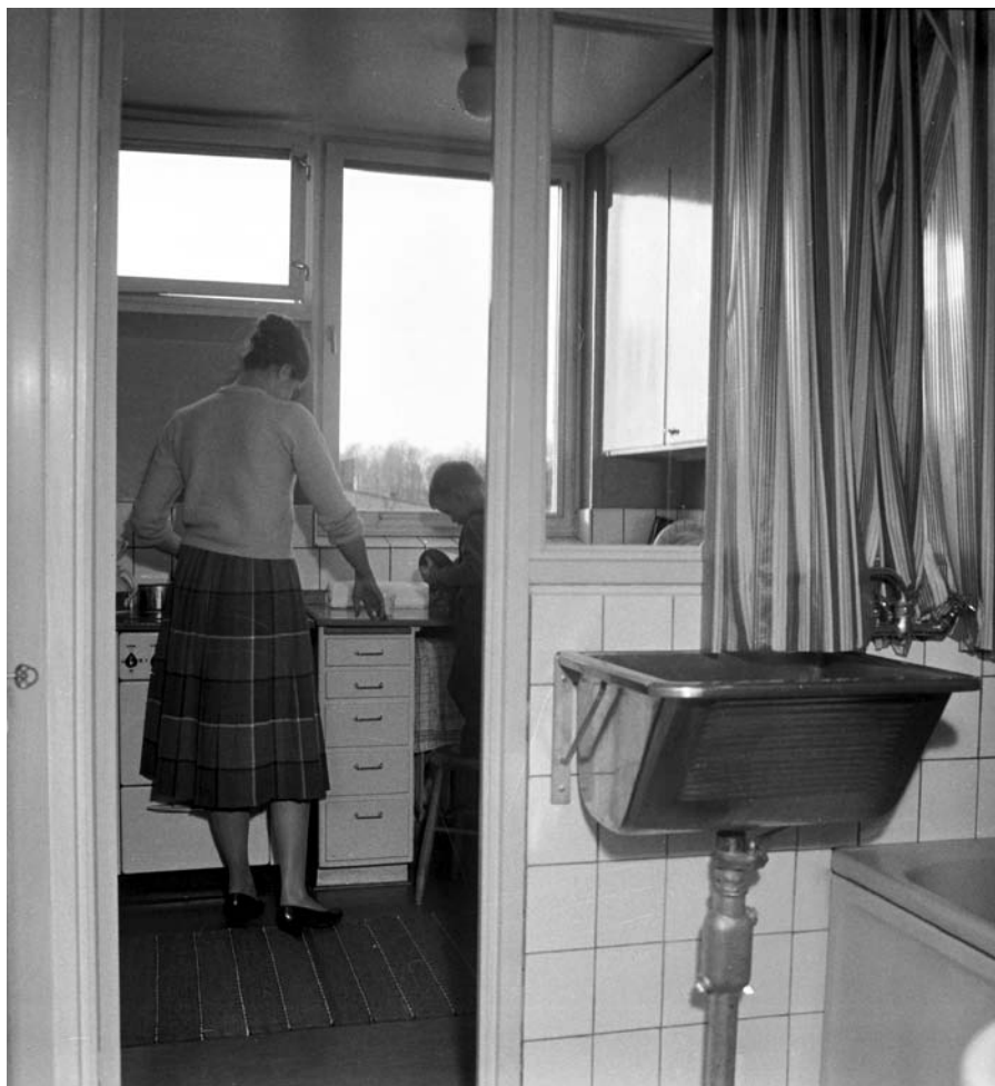
Experimentlägenhet i Baronbackarna, 1960-tal.