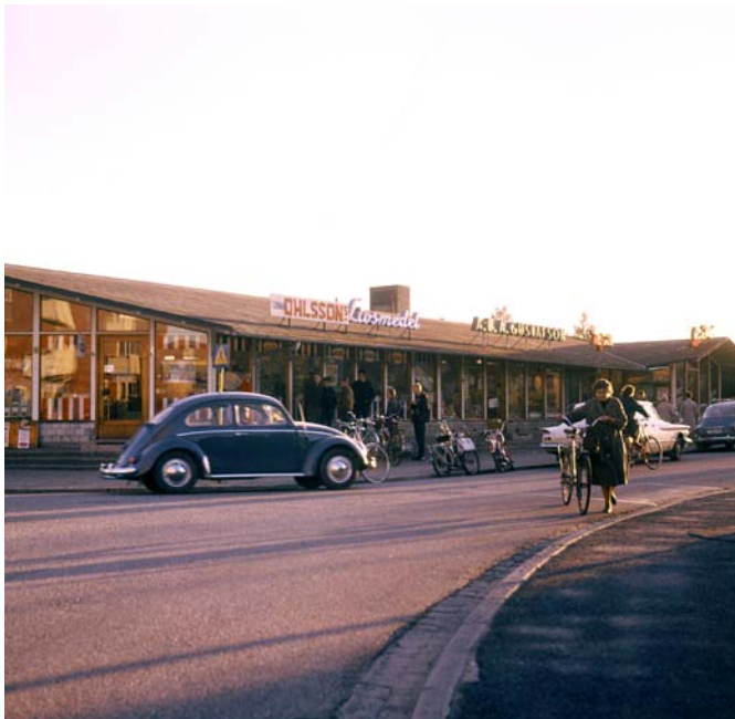
Rosta centrum, 1960-tal.