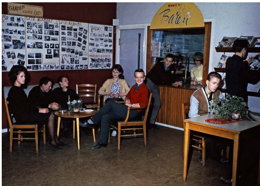
Ungdomsgården i Rosta, 1960-talet.