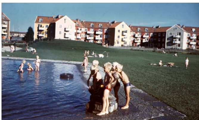
Barn vid plaskdamm, Rostaparken, 1951.