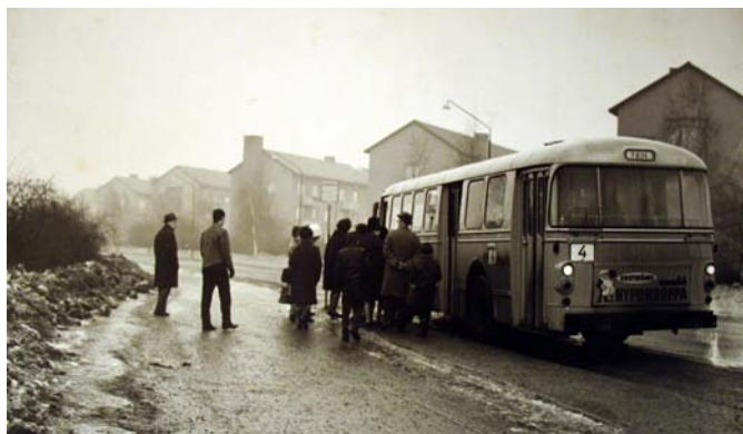
Busshållplats i Rosta, Hagagatan, 1960-tal.