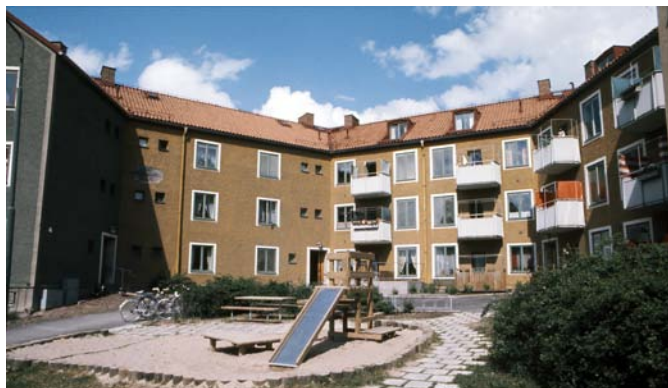
Lekplats i Rosta, 1970-tal.