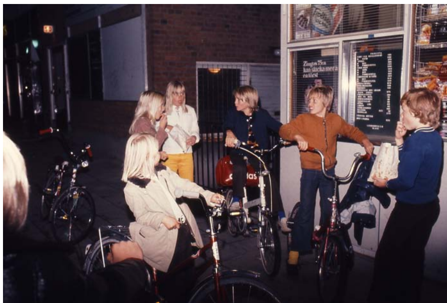
Korvkiosk i Baronbackarna, 1970-tal.