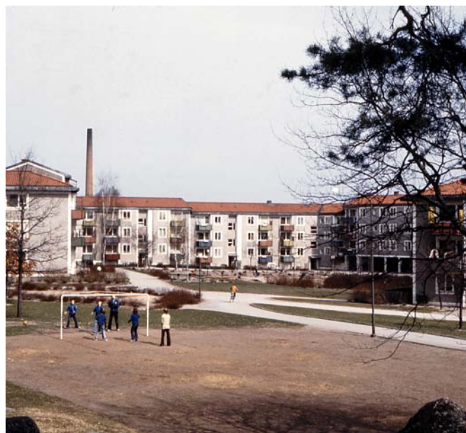
Fotbollsplan i Baronbackarna, 1970-tal.