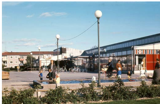
Baronbackarnas centrum, 1960-tal.