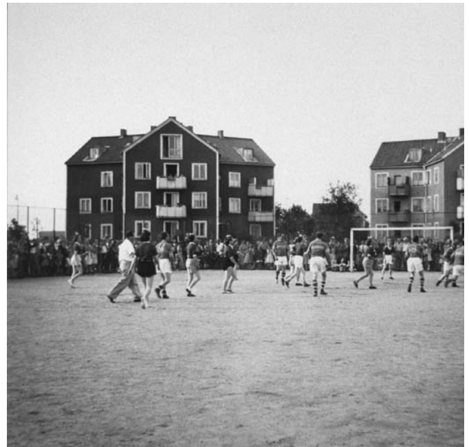
Fotbollsmatch vid Stjärnhusen, 1950-tal.