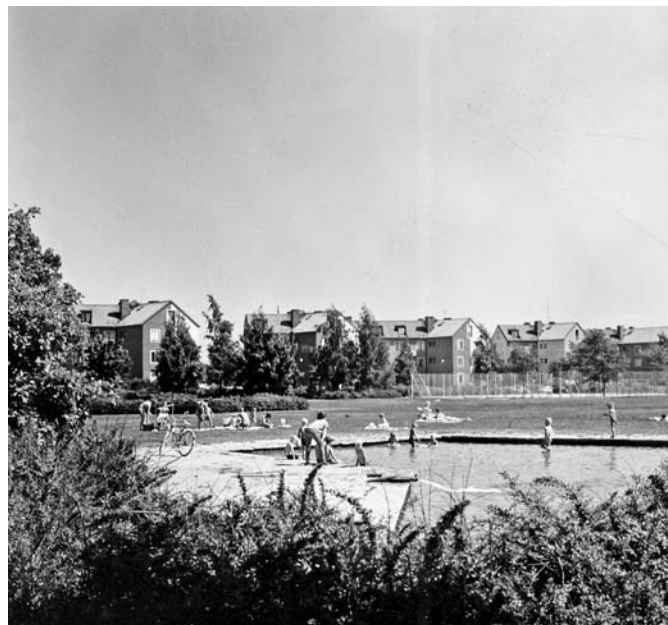
Vattenplask i Rosta, 1960-tal.