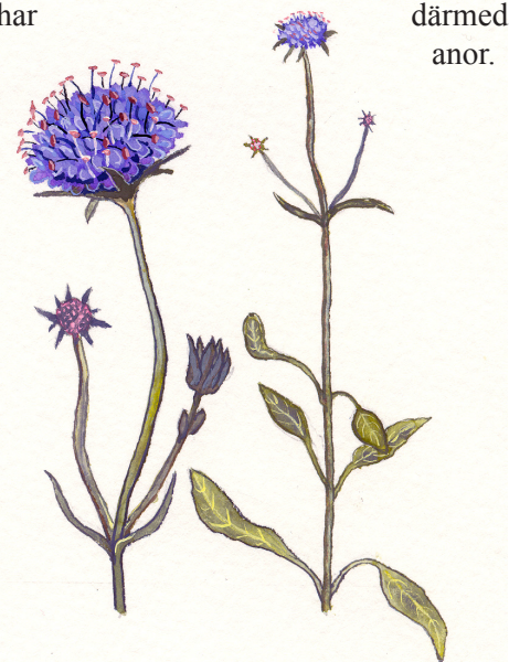
Ängsvädd, Michael Hollmberg

Området har en lång historia av mänskligt nyttjande. Flera fynd av stenyxor visar att människan funnits i området sedan bondestenåldern (ca 4200–1800 f. Kr.). På krönet av drumlinen, i den nordvästra delen av reservatsområdet, finns ett gravfält som består av 13 låga, runda stensättningar. Söder om gravfältet finns en högliknande stensättning. Både gravfältet och den högliknande graven kan dateras till järnåldern (ca 500 f. Kr.–1050 e. Kr.). Centralt i naturreservatet ligger två fossila åkrar med tydlig indelning i åkerteigar. Åkrarna kan ha tagits i bruk så tidigt som under medeltiden (ca 1050–1527). Längs den västra kanten av Håvesta ekhage löper en hålväg i nord-sydlig riktning. Den nuvarande hålvägen är troligen från 1700–1800-tal, men vägsträckningen har sannolikt ett samband med gravfältet och har därmed mycket gamla anor.