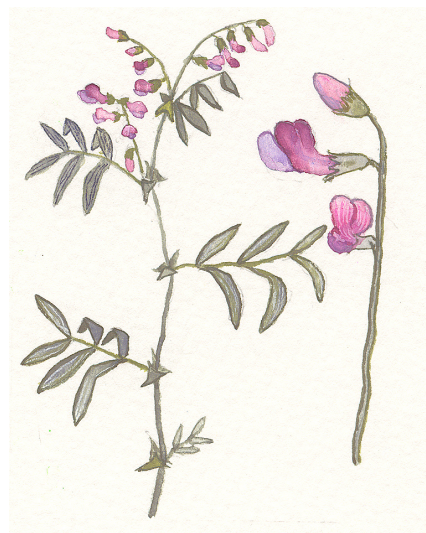
Gökärt, Michael Hollmberg

I naturreservatet finns många växter som gynnas av bete av växtätande kreatur och att marken inte gödslas. Här växer blekstarr, blåsuga, bockrot, gråfibbla, gökärt, harstarr, hirsstarr, liten blåklocka, nattviol, prästkrage, rödkämpar, stagg, vårbrodd, ängsviol och ängsvädd.