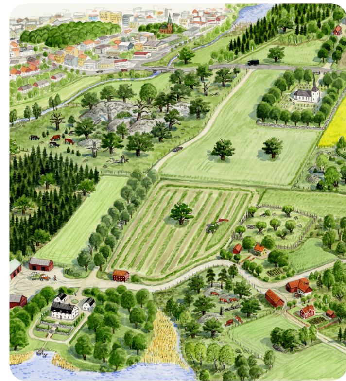
Illustration framsida: Nils Forshed. Övr. illustrationer Per Axell. Form: Ylva Englund

Om du har frågor eller vill veta mer kontakta Länsstyrelsen i Västmanlands län, tel 021-19 50 00 (vxl)