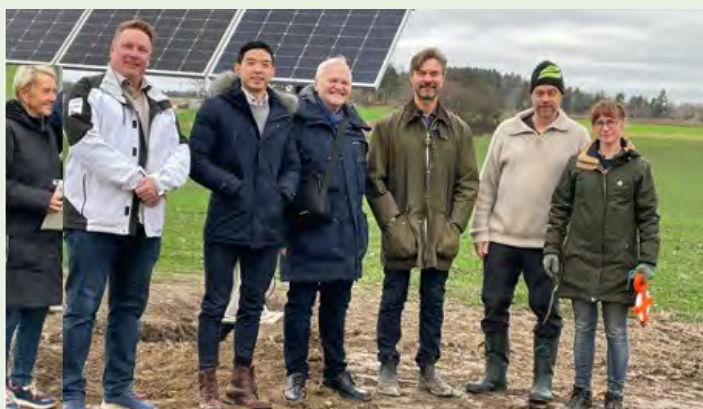
Innovationsgrupp Self Sustainable Farm