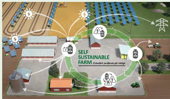
Visionen Self Sustainable Farm

Nästa steg i projektet är att fokusera på energiomvandling och energilagring. En teknikbod ska sättas upp på plats, provkörning och tester samt validering av teknik och verkningsgrader ska genomföras. ■