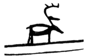
Guvvieh gievrjste Vaapsteneste mij daelie gäävnese British Museumesne Londonisnie.