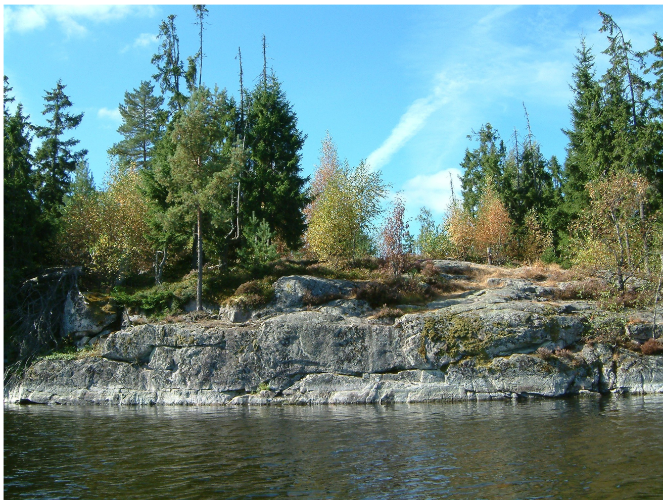
Galtö med klippstrand mot nordost