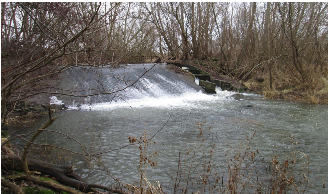
Bild: Exempel på partiellt vandringshinder i Braån vid Årupsmölla. Här finns möjlighet att återskapa strömvattenmiljöer och fria vandringsvägar.