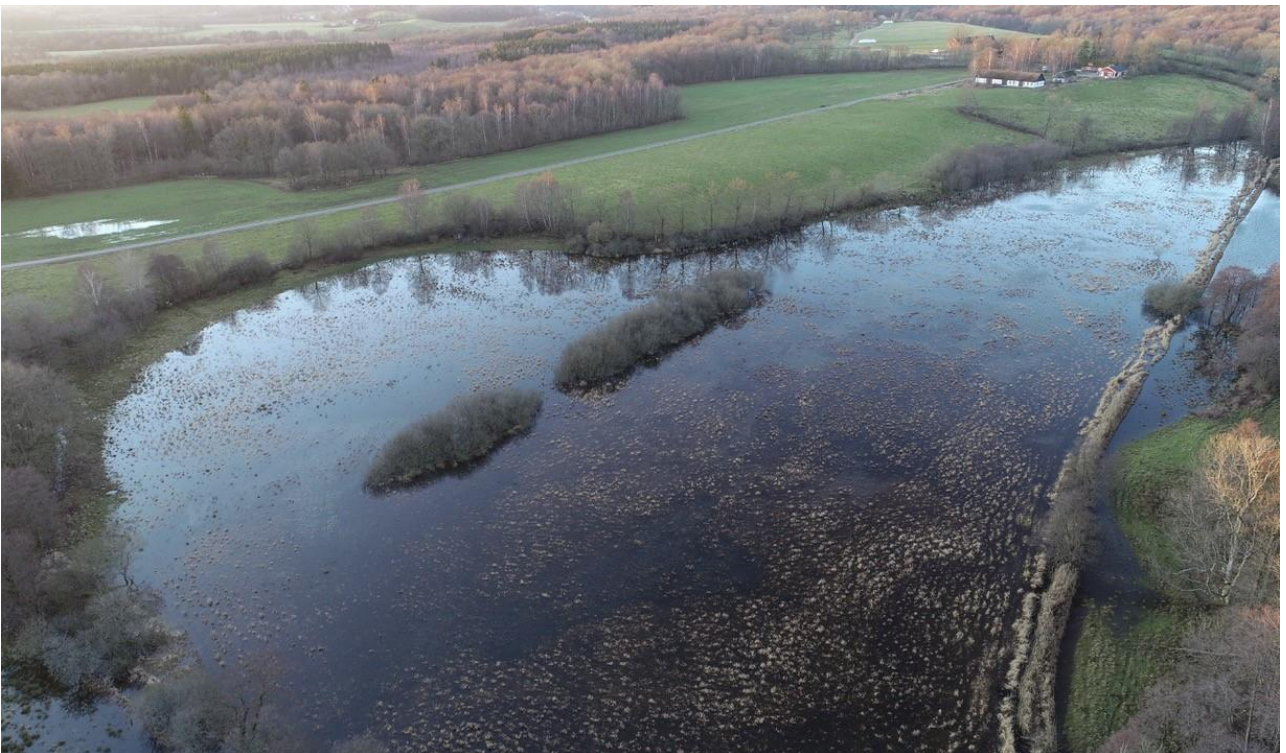
Bild: Exempel på återställt svämplan vid Bauseröd i Hallabäcken, Vege å. En meandrande fåra har återställts och det tidigare rätad diket (till höger) har lagts igen. Fotot är taget vid högvatten då vattnet bräddar ut på svämplanet.