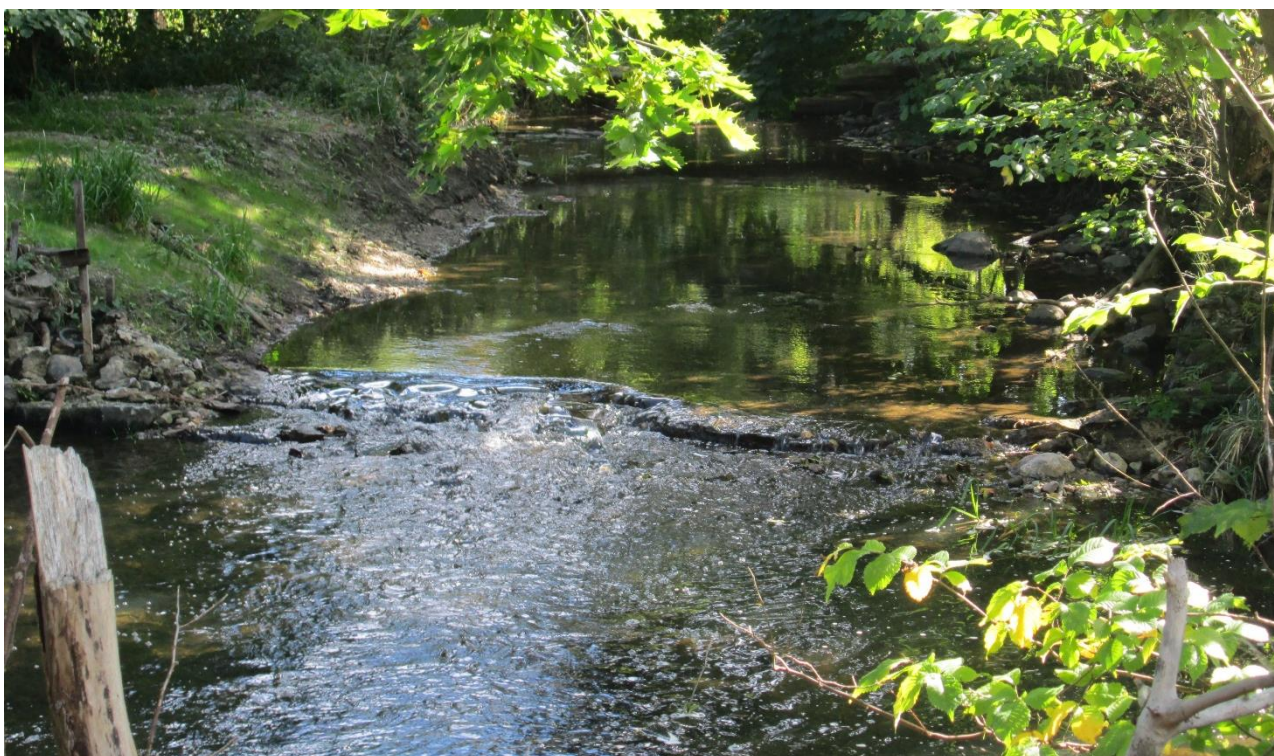
Bild: Exempel från Saxån på hur vandringshinder har åtgärdats, genom utrivning av fördämningen vid en kvarn.