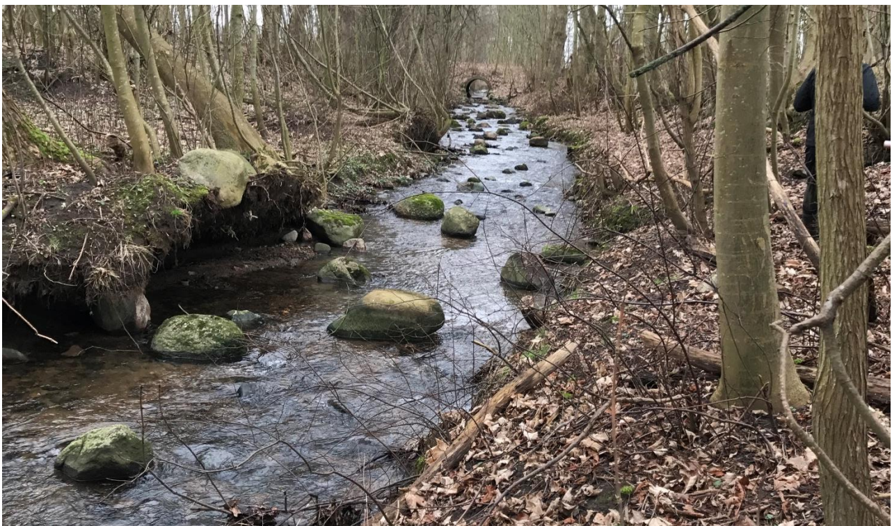
Bild: Exempel på blockrestaurerad stömsträcka vid Västregård i Kövlebäcken, Råån. Block och sten har tagits från rensvallar längsmed strandkanten och lagts tillbaka i fåran.