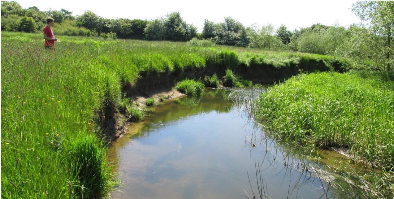
Bild: Saxån och Braån rinner genom markerade dalgångar där det finns möjlighet att återställa strukturer och funktioner. Länsstyrelsen Skåne.

Saxån | Svalövs, Landskronas, Eslövs och Kävlinge kommun | HARO 93