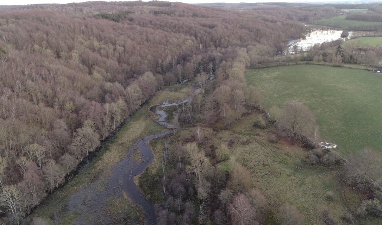
Bild: Exempel på återmeandrad sträcka vid Bauseröd i Hallabäcken, Vege å. En meandrande fåra har återställts och det tidigare rätad diket (längsmed trädridån till väster) har lagts igen.