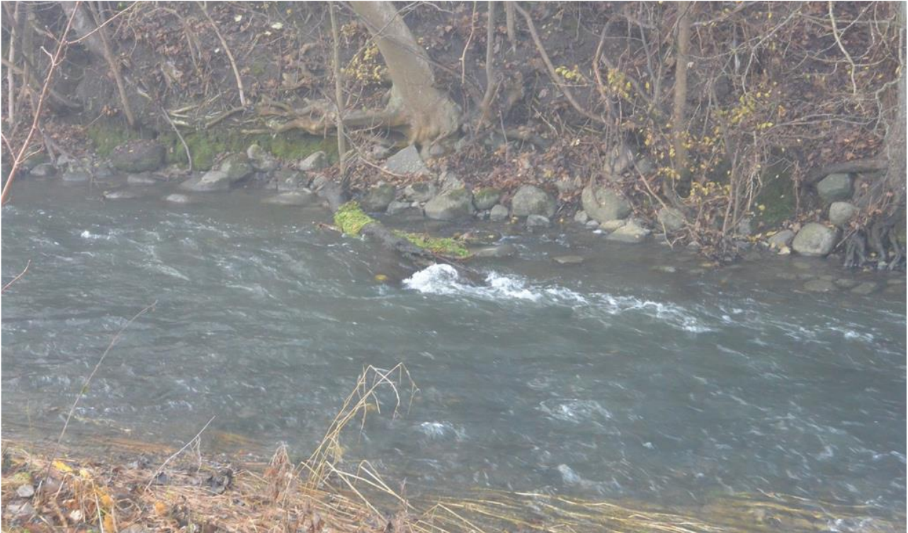
Bild: Exempel på blockrensad strömsträcka i Saxån. Block och sten har tagits från fåran och lagts i rensvallar längsmed strandkanten.