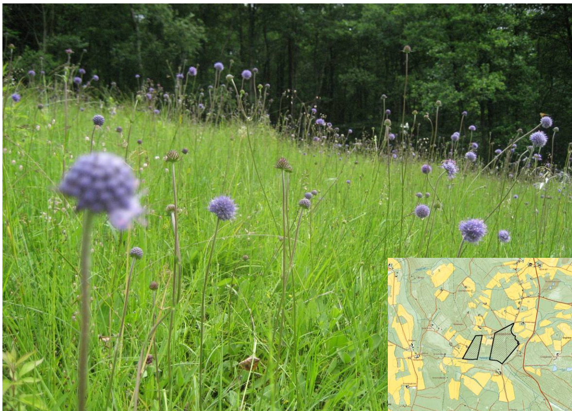
Smedjebacken (ängsvädd i Orrödsjärret).