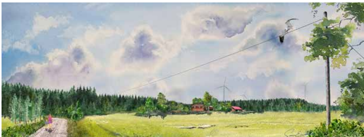
Vy från Gåstorp mot vindparken