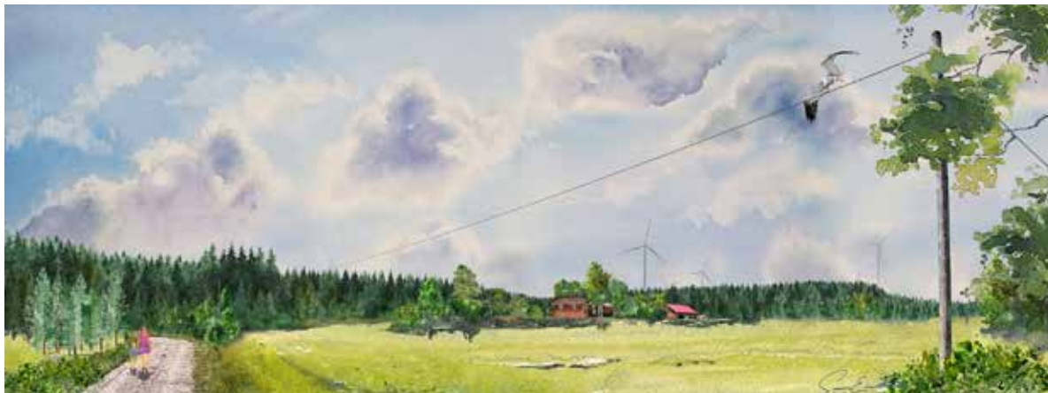
Vy från Gåstorp mot vindparken, illustration av Susan Enebjörn, Ecogain AB.