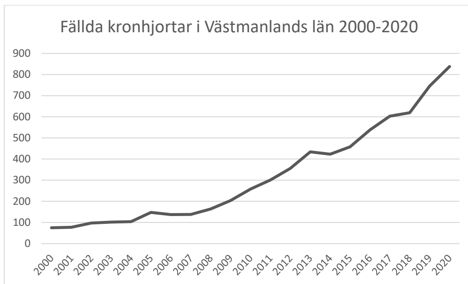
Figur 2. Avskjutning av kronhjortar i Västmanlands län jaktåren 2000–2020 14 .

Det är viktigt att det finns en tillräcklig andel fullvuxna hanhjortar (6 år och äldre) i populationen, då de spelar en viktig roll under brunsttiden, för att brunstcykeln ska fungera och hindarna bli betäckta vid bästa tidpunkt och undvika ombrunstning 6 . Få fullvuxna handjur leder till att yngre hjortar i en högre utsträckning stressar hindarna under brunsten och inte låter dem söka föda i lugn och ro vilket ger dem en sämre förberedelse inför vintern och den kommande dräktigheten 6 .