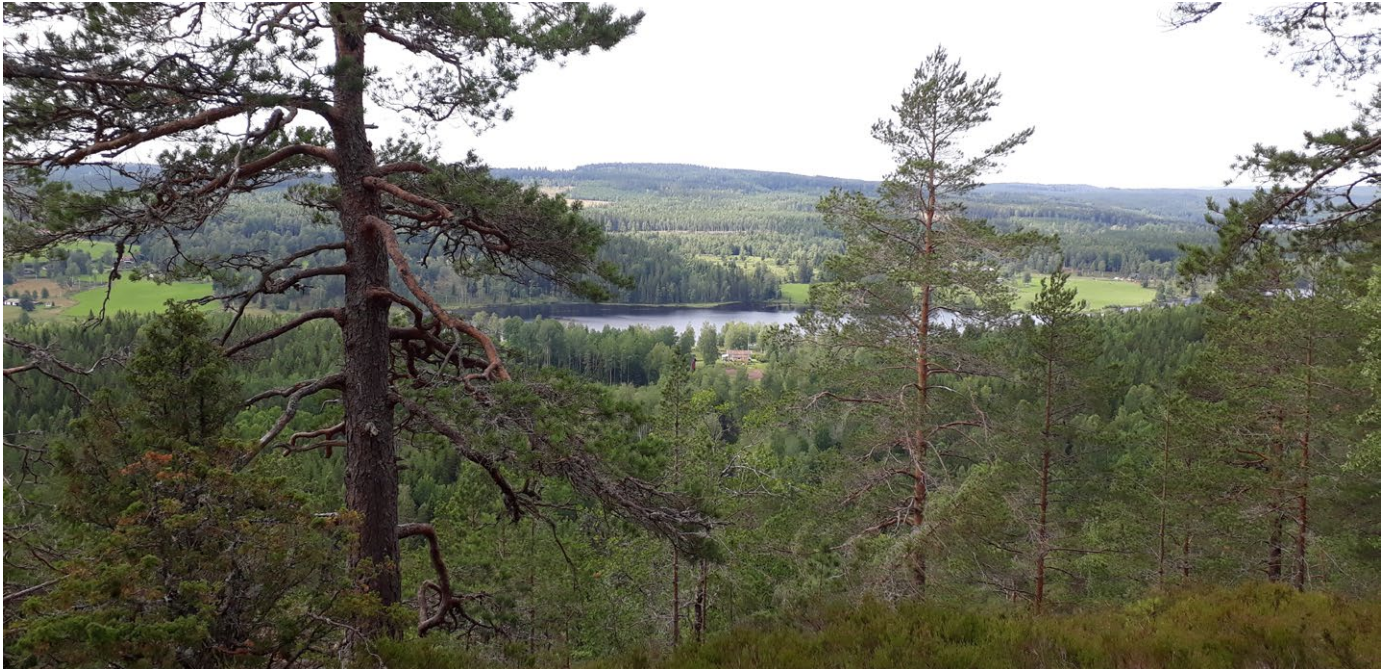
Utsikt över Rastälvens dalgång från Erikaberget.

Erikaberget är ett välkänt utflyktsmål sedan många år tillbaka. Från toppen av Erikaberget, 210 meter över havet, bjuds besökaren en vacker utsikt över Rastälvsdalen, en av Bergslagens dalgångar som l öper i nord-sydlig riktning. Förr vallfärdade gästerna på den gamla kurorten i Nyhyttan upp till toppen för att njuta av den friska luften och solnedgången.