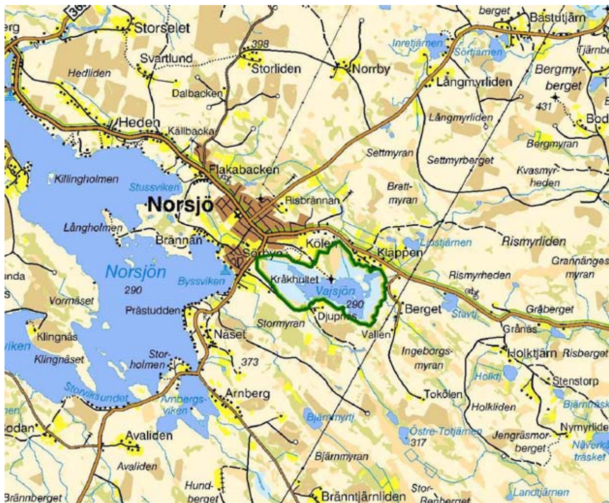
Figur 1. Översiktskarta för Vajsjöns naturreservat.

Våtmarken är en betydelsefull häcklokal för sjöfågel, men är framförallt viktig som rastlokal för ett stort antal arter. Årligen rastar mängder av sångsvan, sädgås, trana, sjöorre, brushannar, doppingar, storlom samt ett flertal arter av vadare. Vajsjön utgör häcklokal för bl.a. gräsand, stjärtand, skedand, knipa, vigg och kricka. Inom reservatet finns numer ett stort antal fågelholkar. Under perioden 15/4 – 15/8 är det förbjudet att vistas inom delar av reservatet.