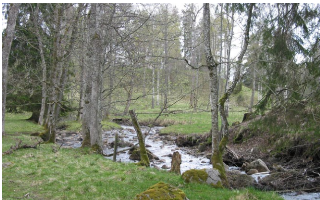
Forsande vattendrag drar ofta till sig en stor biologisk mångfald.

Vattnets eroderande krafter påverkar hela tiden stränderna, och man kan se flera exempel på detta i