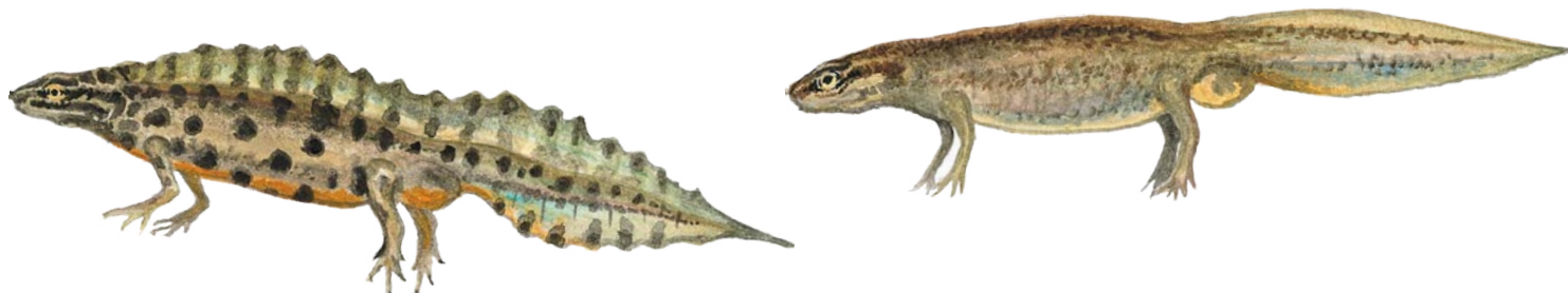
Större vattensalamander (hane ovan, hona t h)