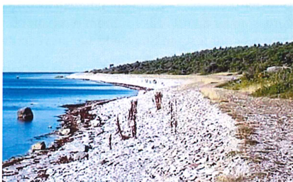
Figur 2. Kustavsnitt på Ekstakusten