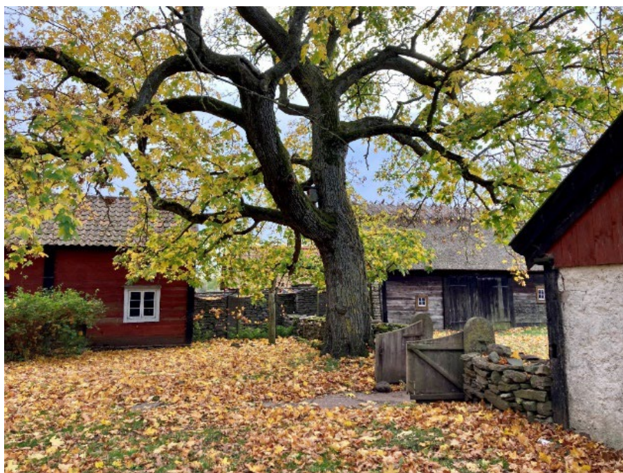
Himmelsberga, Ölands museum

Vårdar du en kulturmiljö så att den bevaras för framtiden? Eller arbetar du för att göra en kulturmiljö mer tillgänglig och användbar? Du kan söka bidrag för det hos Länsstyrelsen.