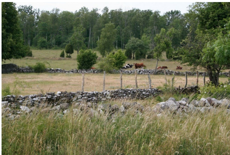
Betesmarker vid Jordtorpsåsen.

Du kan få ersättning om du sköter och bevarar betesmarker, slåtterängar, skogsbete, mosaikbetesmarker eller gräsfattiga marker.