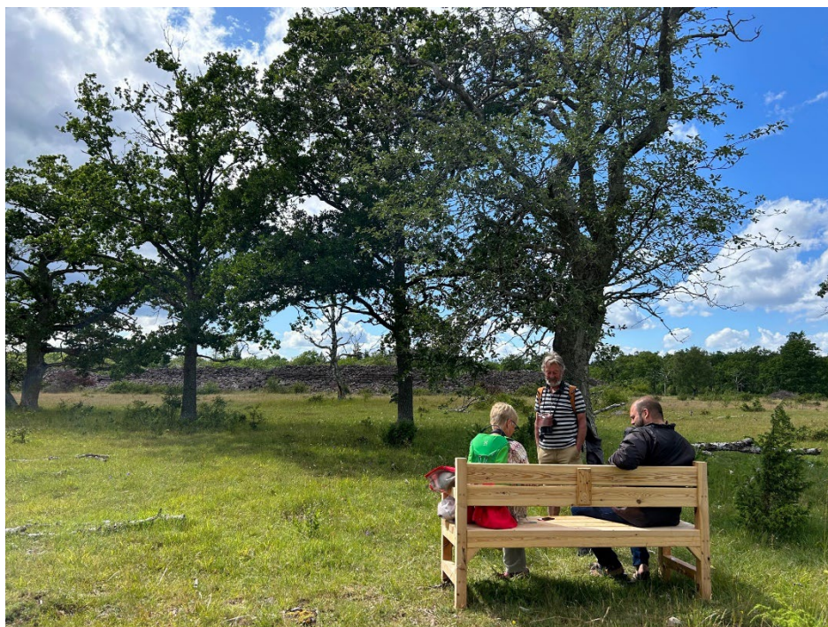
Berättarbänk med QR-kod, vid Ismantorps borg.

Om du vill bevara värdefull natur på din mark utan att bilda naturreservat, biotopskyddsområde eller skriva naturvårdsavtal kan du göra en så kallad frivillig avsättning. Det innebär att du sparar en bit av din fastighet från skogsbruk eller andra åtgärder som kan skada naturvärden, kulturmiljövärden eller sociala värden. En frivillig avsättning dokumenteras i en skogsbruksplan eller annan handling och du får ingen ersättning.