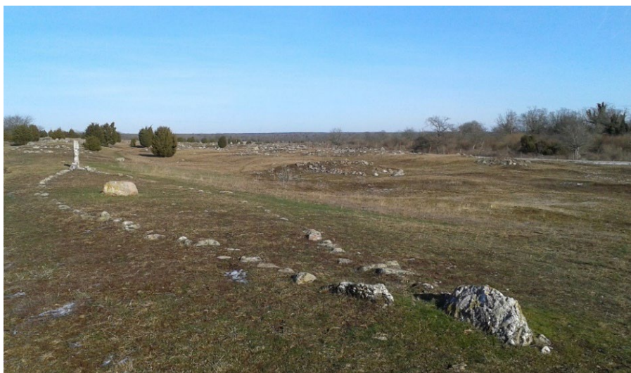
Gravfältet Noaks ark, Karum