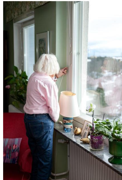
Figur 1. Mörkläggningsgardiner eller persienner kan nyttjas för att sänka temperaturen inomhus.

Genom att vidta dessa åtgärder kommer ni att kunna skapa en säker och bekväm miljö för både de som vistas i fastigheten under värmeböljor. Det är viktigt att vara proaktiv och anpassa er fastighet till att klara extrema väderförhållanden för att säkerställa hög kvalitet och trivsel för alla. Som fastighetsägare spelar ni en nyckelroll i att skapa en hållbar och anpassningsbar miljö för era hyresgäster och verksamheter.